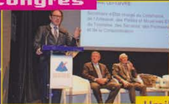
Umih à Biarritz