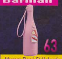
Mumm Rosé St Valentin